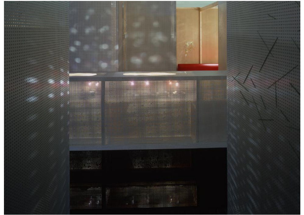
Designprijs 2003 Rotterdam 'paviljoentjes'