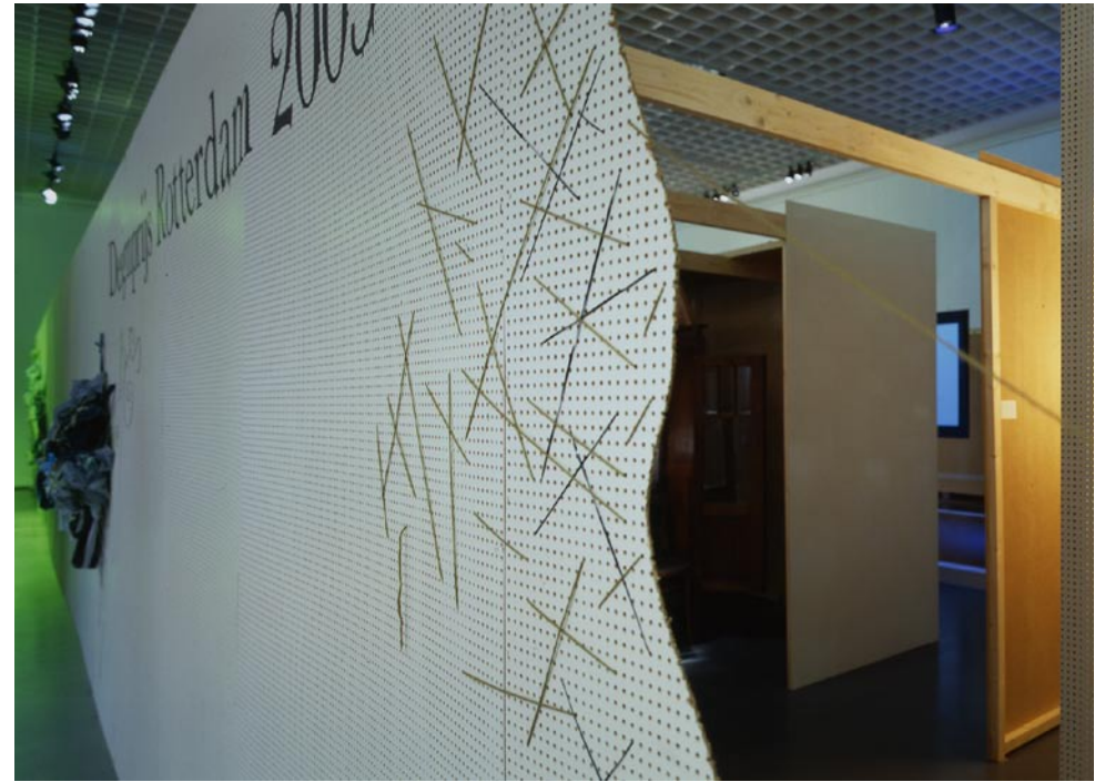
Designprijs 2003 Rotterdam entree 01